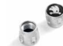
Ozdobne nakrętki wentyli