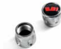
Ozdobne nakrętki wentyli RS