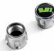
Ozdobne nakrętki wentyli Motorsport